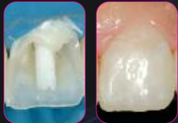
Эстетические прямые реставрации сделаны с ENA POST и Enamel Plus HRi