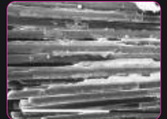
ENA POST в разрезе под увеличением (от проф. V.Kaitsas)