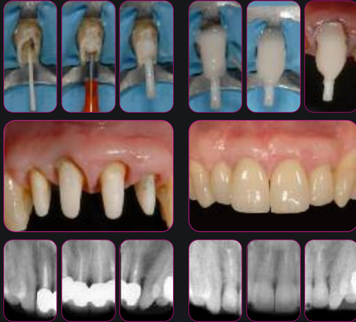
Фиксация ENA POST и надстройка культи зуба с помощью цемента ENA CEM HF Случай от д-ра Лоренцо Ванини