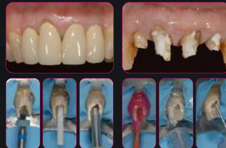
Адгезивная система ENA ETCH-ENA BOND с катализатором